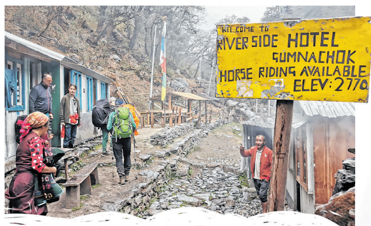
Keine Honeymoon-Suite verfügbar, Dusche Feblanzeige: Das Hotel Riverside auf 2770 Metern Höhe.

Weihnachtswünsche aus Au bei Bad Feilnbach