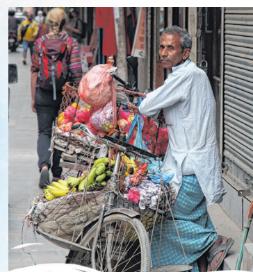
Typisches Bild aus den Gassen von Thamel in Kathmandu.

der Großstadt auf mehrspurigen Straßen drängen, hupende TukTuks, die ebenso ihren Platz für sich beanspruchen und dazwischen völlig unaufgeregte Rikschafahrer, die sich vor allem den Touristen widmen. Diese waren in den Jahren der Corona-Pandemie rar geworden. Allmählich aber erwacht der Tourismus als Erwerbszweig wieder.