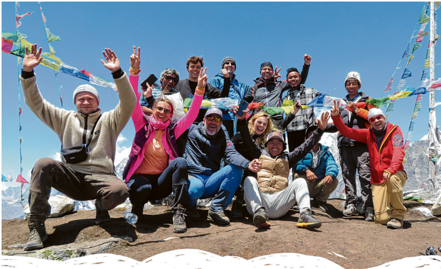
Zu acht machte sich die Reisegruppe aus Altötting und Mühlendorf auf zum Gipfel des Tsergo Ri in Nepal.

Wir haben jede Menge Süßigkeiten mit dabei, die uns die Kinder freudig kreischend fast aus den Händen reißen. In der Dämmerung sind Languren-Affen, eine Meerkatzenart, zu erahnen. Dann beginnt es zu regnen, gerade als wir das „Hotel Riverside“ erreichen. Wobei Hotel übertrieben ist. Es gibt keine Duschen, das fließende Wasser kommt vom Berg oder vom Langtang-Fluss. Entsprechend kalt ist es. Aber immerhin ist der Gastraum geheizt, wo uns Ingwer- und Lemon-Tea wärmt. Strom ist gerade soviel vorhanden, damit wir unsere Smartphones und die Akkus der Fotoausrüstung aufladen können. Die Schlafkojen sind nichts anderes als Wellblechhütten und entsprechend schlecht isoliert. Einige lassen sich heißes Wasser in Plastikflaschen auffüllen, wärmen damit die Füße im Schlafsack.