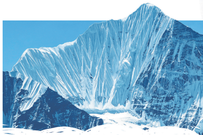
Ein Berg wie gemalt: Der 6378 Meter hohe Gangchenpo.